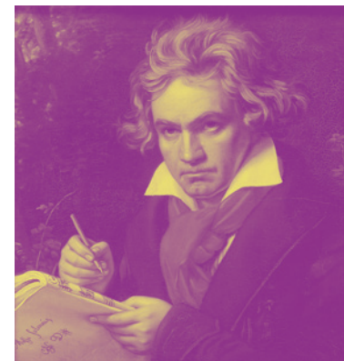
Fotografija: Wikimedia / Joseph Karl

Dobivši prvu glazbenu poduku od oca i lokalnih glazbenika, Ludwig van Beethoven (Bonn, 1770. – Beč, 1827.) u ranoj je mladosti zarađivao kao asistent svojega profesora Christiana Gottloba Neefea. Potom je primao pola očeve plaće kao dvorski glazbenik u Kölnu kako bi se mogao skrbiti o braći, nakon što im se otac odao alkoholizmu. Svirao je violu u raznim orkestrima, a sprijateljivši se s glazbenicima poput Antoinea Reiche, Nikolausa Simrocka i Franza Riesa, počeo je skladati prema narudžbama. Kao član orkestra dvorske kapele, imao je priliku putovati i upoznavati plemiće. Među njima je bio i grof Ferdinand Waldstein koji mu je postao prijatelj i pokrovitelj. Godine 1792. Beethoven se seli u Beč da bi studirao kod Josepha Haydna. Unatoč njihovu promjenjivom odnosu, Haydnova je jedinstvena osobnost bila poticajna u oblikovanju Beethovenova stila. Stigavši u austrijski glavni grad s najvišim preporukama, Beethoven je ubrzo stekao ugled kao pijanist i skladatelj, prihvaćajući svaku pomoć pokrovitelja. Još je kao mladi skladatelj u Bonnu pratio tadašnje trendove;