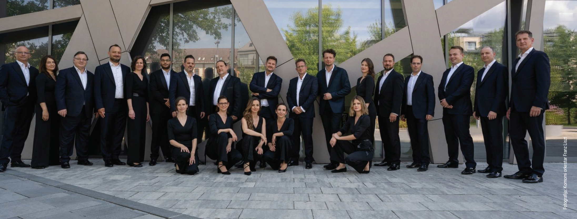
Fotografija: Komorni orkestar Franz Liszt