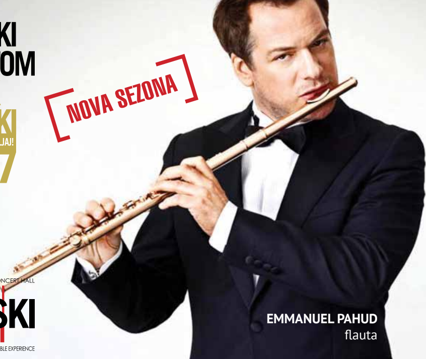
EMMANUEL PAHUD flauta

NEPROCJENJIV DOŽIVLJAJ INVALUABLE EXPERIENCE