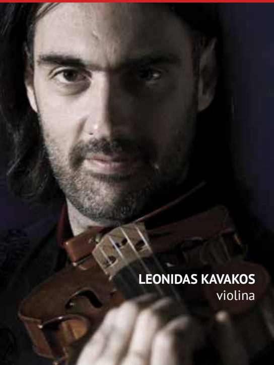
LEONIDAS KAVAKOS violina