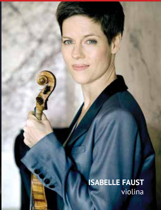
ISABELLE FAUST violina