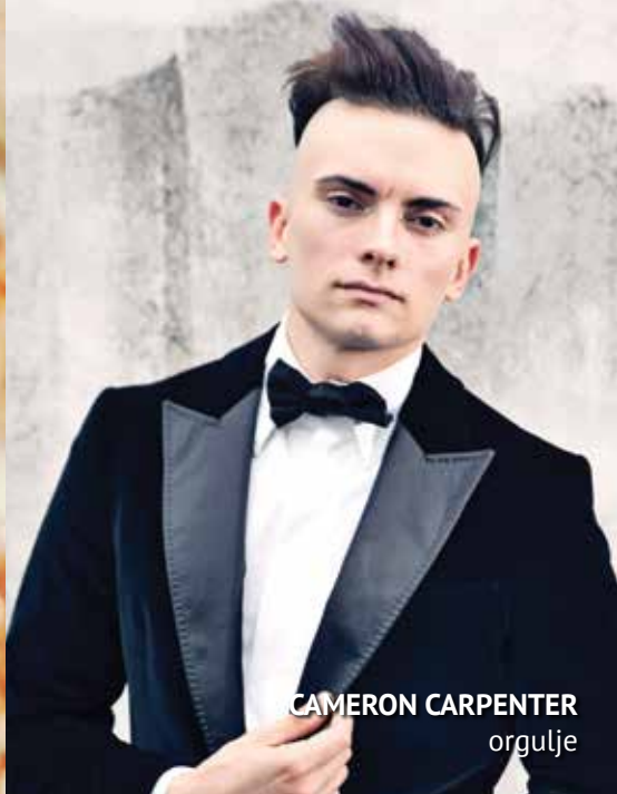
CAMERON CARPENTER orgulje