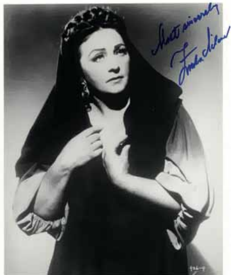
Zinka Kunc Milanov kao Santuzza