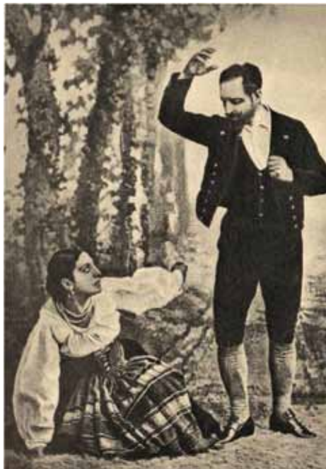
Gemma Bellincioni i Roberto Stagno

Gemma Bellincioni ovako je opisala Mascagnijev trijumf: "Nakon završetka