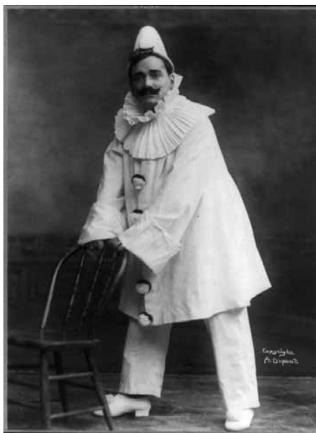
Enrico Caruso kao Canio