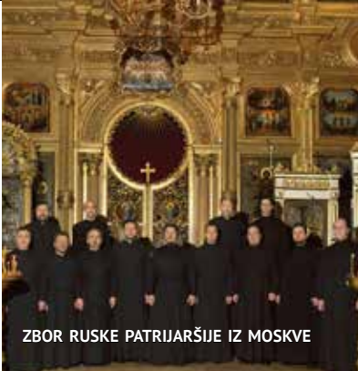
ZBOR RUSKE PATRIJARŠIJE IZ MOSKVE